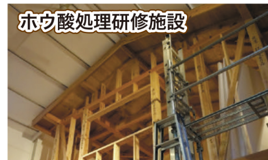
ホウ酸処理研修施設

▲自然素材ホウ酸を散粉する工事。小屋裏、壁内等、ホウ酸処理し、昆虫が生息しづらい環境を作り出すため、シロアリ等の生物劣化を長期間予防します。